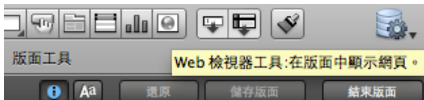
圖 1: 點選 Web 檢視器

先切換到版面模式， command + L ，在上方工具列點選很像瀏覽器的圖示，就是 Web 檢視器工具，如圖 1 所示，點下後，在您的工作區塊拉出您要顯示的大小，就可以了。