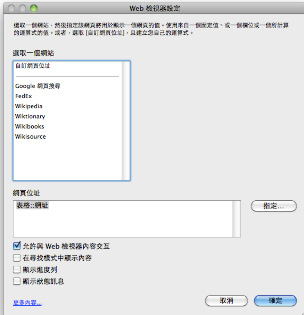
圖 3：在物件點二下後進入的 Web 檢視器設定。

因為還沒設定完，所以點選該拉出來的物件大小二下，可以進入 Web 檢視器設定，如圖 3 所示。